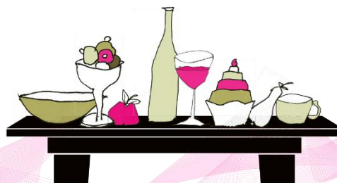
Suite's „Tischlein deck Dich“

Nur auf Vorbestellung für mindestens zwei Personen. Kinder werden mit 1,-€ pro Lebensjahr berechnet. Tickets zum Verschenken im Café erhältlich.